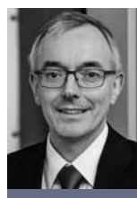
Norbert Westfal Präsident BREKO Bundesverband Breitbandkommunikation e. V.