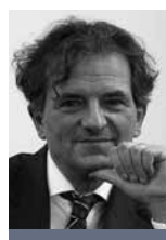
Theo Weirich Präsident BUGLAS Bundesverband Glasfaseranschluss e. V.